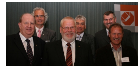
Ihre Kollegen: Der Vorstand der Handwerkskammer Lübeck