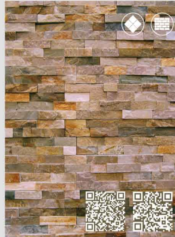
FLIESEN-, PLATTEN- UND MOSAIKLEGER/IN MAURER/IN