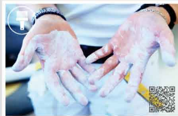
MALER/IN UND LACKIERER/IN