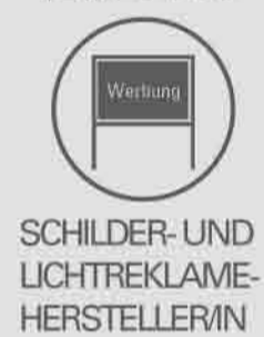
SCHILDER- UND LICHTREKLAMEHERSTELLER/IN